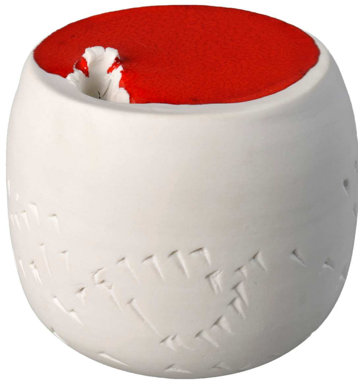
Jean-Pierre Viot (né en 1936). Tulipe . 2006. Porcelaine