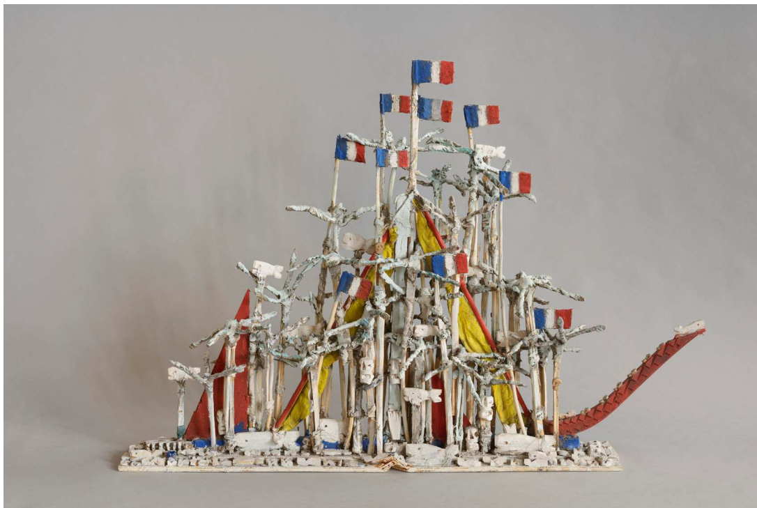
Armand Avril (né en 1926), Barque des morts . 2010. Bois et tissus peints.

Ces objets « Métis » occupent une place de choix dans la collection du couple Meynet et font l'objet d'une scénographie particulière dans l'exposition dans la salle 200.