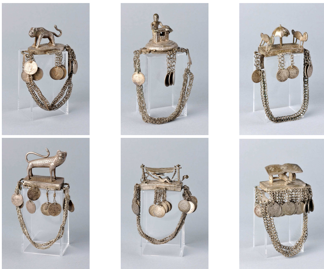
Bracelets de prêtresse vaudou, Bénin, peuple Fon. Première moitié du 20 e siècle. Métal à forte teneur en argent (avec le cas échéant des pièces françaises ou anglaises).