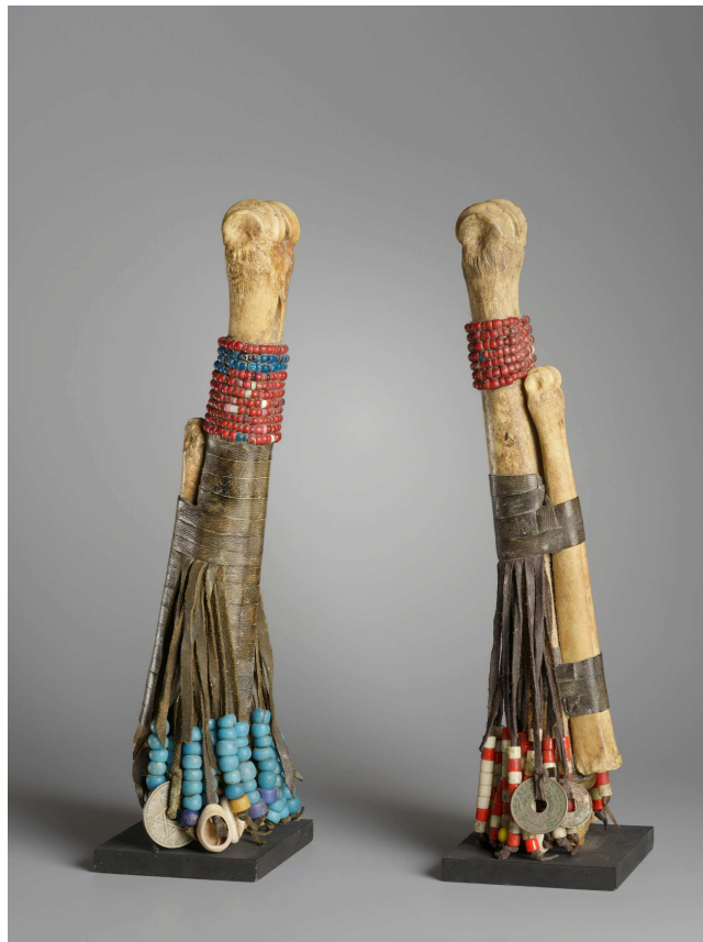
Poupées. Nigeria, 2 de moitié du 20 e siècle. Os, cuir, perles, cauris, anneaux en laiton, monnaies datées de 1949, 1951 et 1952.

Dans la collection Meynet, certains objets oscillent entre naturalia et artificialia : l'œuf d'autruche transformé en flacon par les populations bochimans qui l'utilisent comme « boîte à riz », un bouclier provenant d'Afrique de l'est fabriqué à partir d'une carapace de tortue, ou encore des fémurs, devenus des poupées de fertilité au Nigeria.