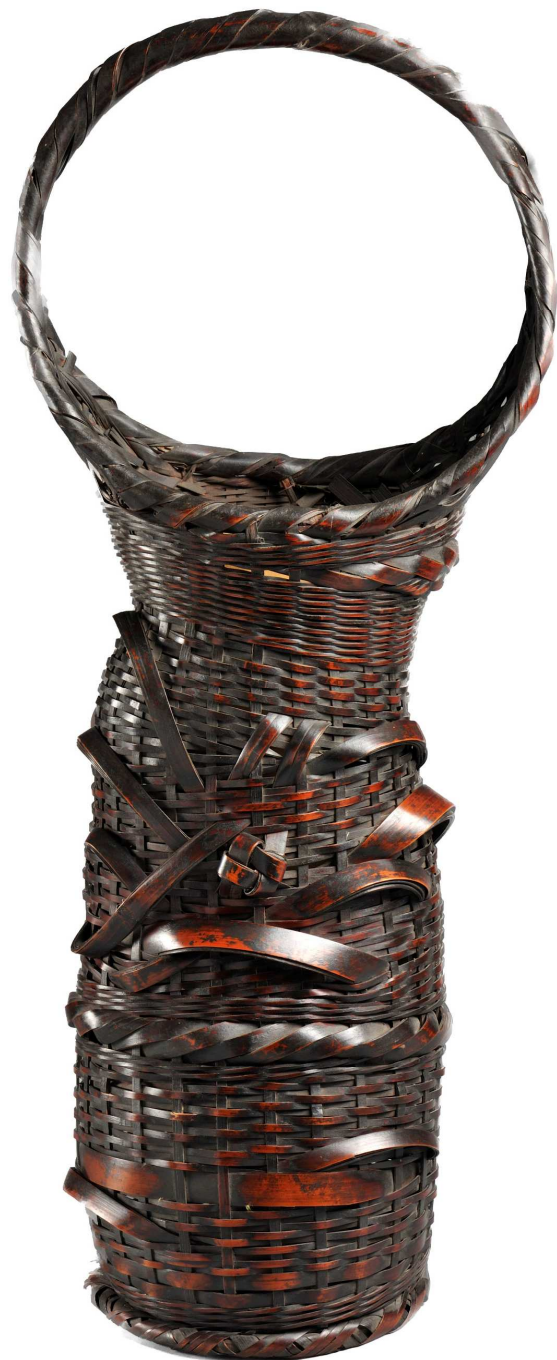
Vannerie pour ikebana. Japon, 20 e siècle. Bambou tressé