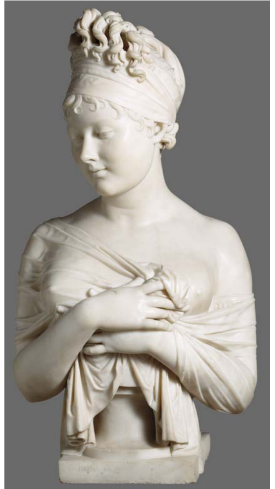
Joseph Chinard, Juliette Récamier (détail), 1805/1806 ?, Musée des Beaux-Arts de Lyon, © Lyon, MBA / Photo Alain Basset 2008.