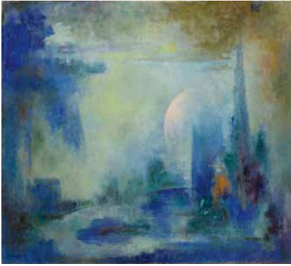
Paul Régnny, Vespéral , 1981, huile sur panneau de contreplaqué.

© Succession Le Coultre / Régnny. Image © Lyon MBA – Photo Alain Basset