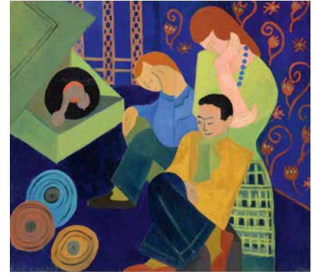
Andrée Le Coultre, La Musique , 1945, huile sur contreplaqué.

© Succession Le Coultre / Régnny. Image © Lyon MBA – Photo Alain Basset