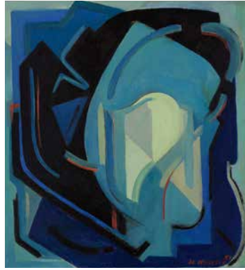
Andrée Le Coultre, Composition , 1951, huile sur carton.

© Succession Le Coultre / Régnny.