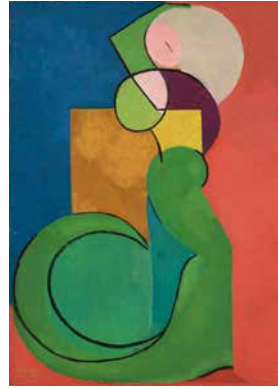
Paul Régnny, Flamenco , 1944, huile sur toile.

© Succession Le Coultre/Régnny. Image © Lyon MBA – Photo Alain Basset