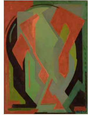
Paul Régnny, Composition , 1948, huile sur toile.

© Succession Le Coultre/Régnny. Image © Lyon MBA – Photo Alain Basset