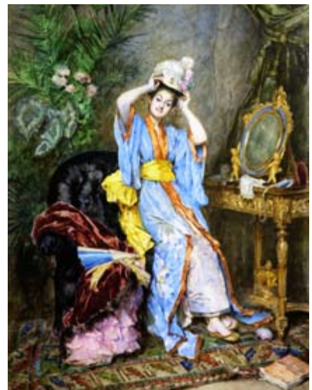
Madeleine Lemaire, La Japonnaise à Paris , 1886 coll.part.

De l'Expressionnisme (Gabrielle Münter, Marianne Werefkin) aux constructivistes russes (Alexandra Exter).