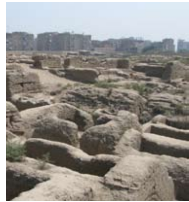
Vestiges de la ville de Boubastis