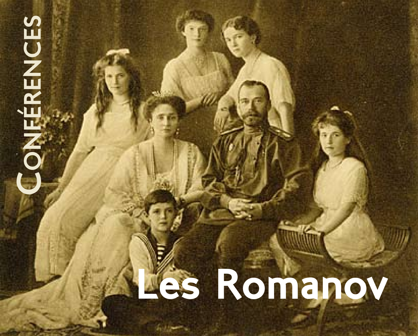
Photo des Romanov