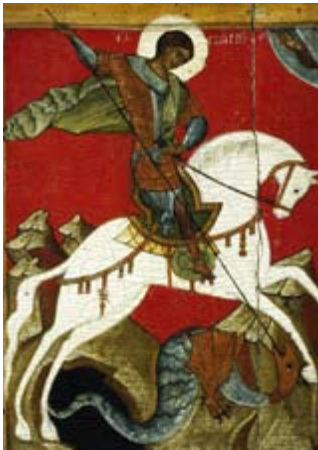
Icône de Saint Georges tuant le dragon, Ecole de Moscou

Descendants d'une famille de Boyard, les Romanov s'affirment à la Cour moscovite dès le règne d'Ivan le Terrible dont la première épouse, Anastasia Romanovna exerce une influence apaisante sur le tsar. Au début du 17 e siècle, la Russie est traversée par la plus grave crise de son histoire. Menacé d'éclatement, le pays occupé par les Polonais, en proie à la guerre civile, va se reconstruire