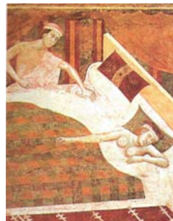
Fresque de la chambre du Podestat, XIV ème siècle Palais du Podestat, San Gimignano, Italie

INSTITUT LUMIÈRE 25, rue du 1 er Film- 69008 LYON métro D / Monplaisir Lumière