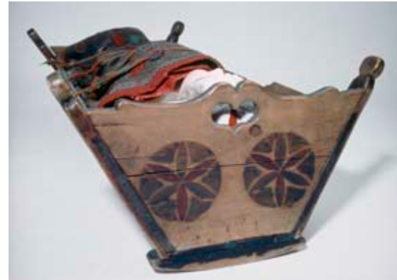
Berceau, Savoie 19 ème siècle MuCem, musée des civilisations de l'Europe et de la Méditerranée

De la naissance à la mort, le lit théâtre de la vie.