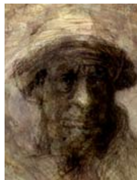
Jean-Luc Giraud, Au retour de la pêche aux palourdes , technique mixte. 2009

Depuis la naissance de la photographie, et jusqu'à l'apparition de l'image numérique aujourd'hui, le dessin a subi dans l'art une complète métamorphose. En déclin dans l'art moderne, puis l'art contemporain où elle a pratiquement disparu pendant longtemps, la pratique savante du dessin s'est développée au contraire dans des genres populaires nouveaux qui ne bénéficiaient pas du prestige des beaux-arts (dessin de presse, illustration, affiche, bande dessinée, dessin animé), tandis que se répandait une approche plus primitive, dont l'art brut offre l'exemple le plus spectaculaire. Aujourd'hui le dessin revient en force, sous des formes nouvelles, sophistiquées ou élémentaires, savantes ou brutes, et sur des supports et avec des outils souvent inédits. S'appuyant sur des exemples contrastés choisis aux extrêmes, cette conférence proposera une réflexion sur la nature du dessin à l'époque moderne et contemporaine : dessin naïf ou brut, primitivisme volontaire, dessin savant académique, dessin savant inspiré... Et elle proposera au public un certain nombre de devinettes permettant d'affiner le regard et de démêler peut-être la relative confusion régnant dans l'art actuel.