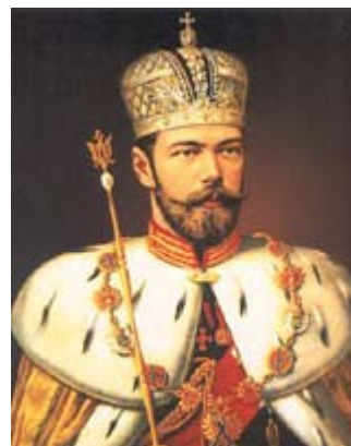
Nicolas II en habit de sacre

Le XIX e siècle s'affirme comme le « grand siècle russe » (Bérélovtich). Les tsars hésitent entre le libéralisme et le conservatisme, la modernisation et la réaction. Malgré l'indécision des Romanov, la Russie continue son irrésistible élargissement : victoire sur Napoléon, conquête du Caucase et de l'Asie