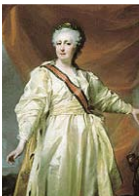
Levitsky, Portrait de Catherine II

Le règne de Pierre le Grand constitue une étape essentielle de l'histoire de la Russie. Après la mort de l'empereur, quatre impératrices vont se succéder. Arrivées sur le trône à la suite de coup d'Etat - Pierre le Grand n'ayant pas réglé sa propre succession - les souveraines vont s'appliquer à légitimer leur pouvoir en prolongeant l'œuvre de celui-ci : élargissement des