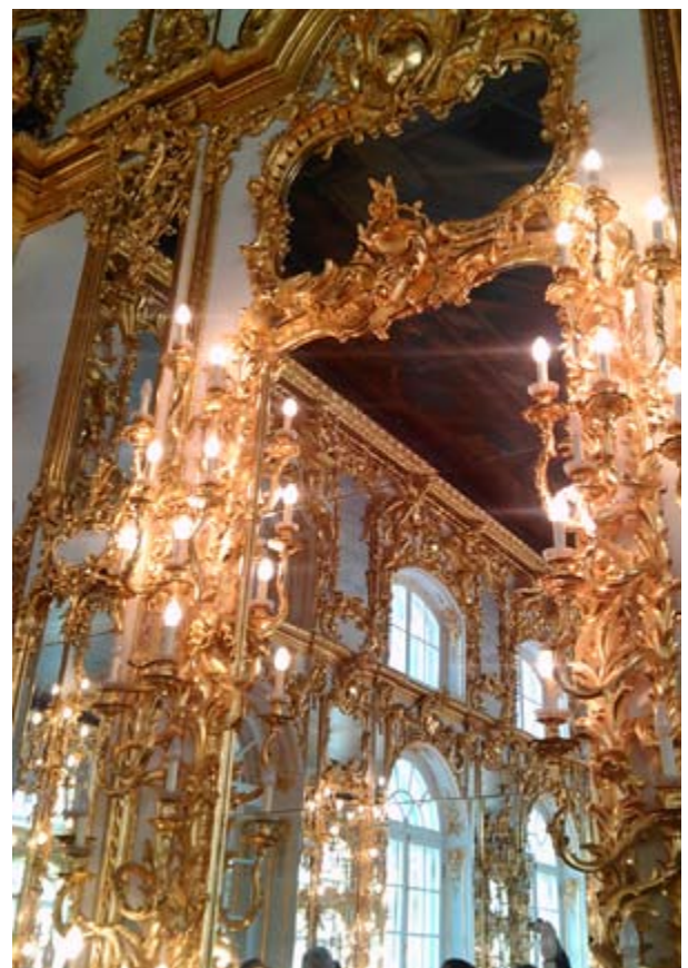
Intérieur de Tsarskoié, salle de bal

centrale, elle est désormais le plus vaste pays au monde. Entre Orient et Occident, le dilemme continue pour les tsars : gendarme de l'Europe, pour Nicolas I er , tsar libérateur pour Alexandre II, hésitations de Nicolas II. La fin tragique des Romanov ne doit pas faire oublier la splendeur de la cour impériale dont les fastueuses célébrations du tricentenaire de la dynastie, en 1913 ont laissé un souvenir ébloui.