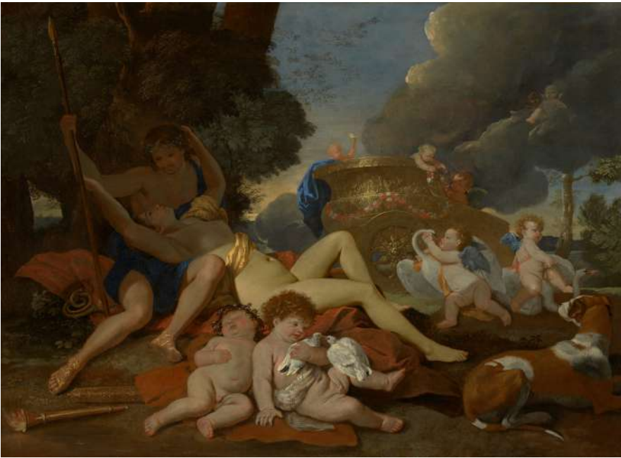
6. Nicolas Poussin, Nymphe endormie surprise par des satyres , vers 1626 Huile sur toile, 100,5 x 122,8 cm Zurich, Kunsthau