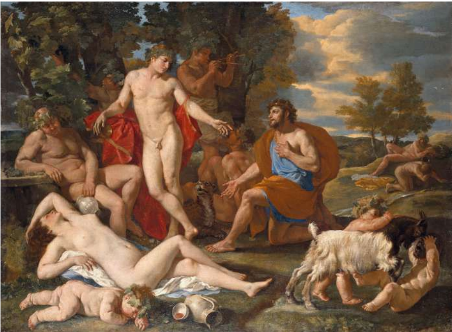
10. Nicolas Poussin, Midas devant Bacchus, vers 1629-1630 Huile sur toile, 98,5 x 153 cm Munich, Alte Pinakothek.