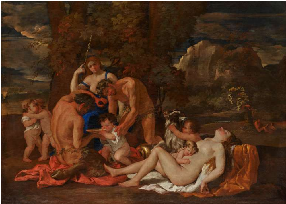
Nicolas Poussin, La Nourriture de Bacchus , vers 1626. Huile sur toile, 97 x 136 cm Paris, Musée du Louvre.