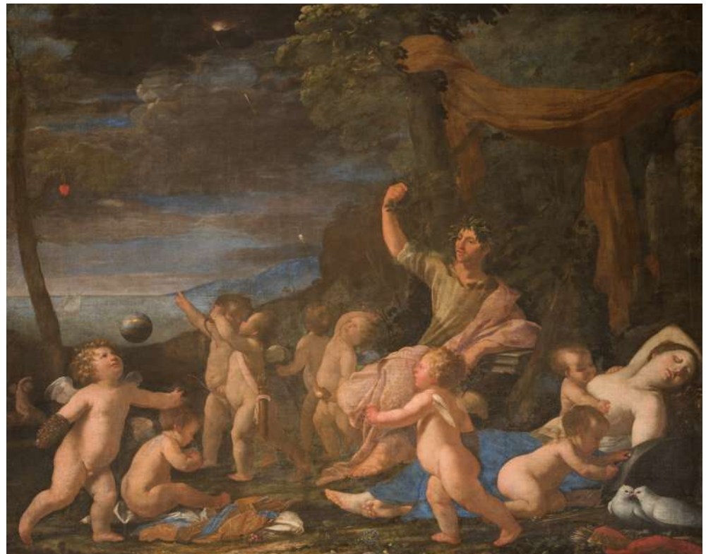
5. Nicolas Poussin, Allégorie du poète ou Le triomphe d'Ovide, vers 1624 Détrempé sur toile, 148 x 176 cm Rome, Palazzo Corsini.