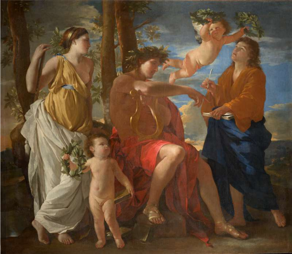
4. Nicolas Poussin, L'inspiration du poète, vers 1628-1629 Huile sur toile, 182 x 213 cm Paris, musée du Louvre.