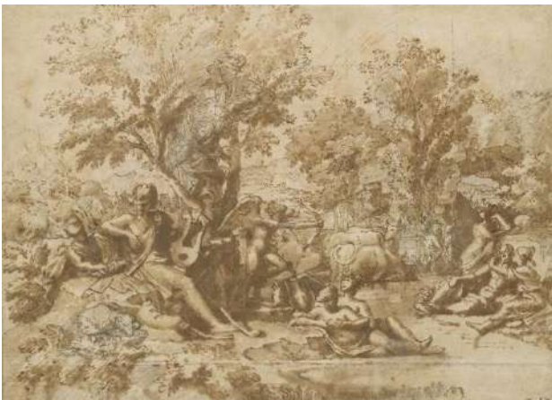
16. Nicolas Poussin, Amours combattant , vers 1626-1627 Plume, encre brune, lavis brun, 20 x 27 cm

Paris, École nationale supérieure des beaux-arts de Paris.