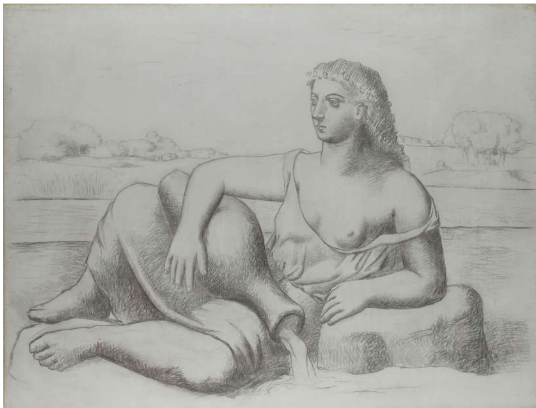
10. Pablo Picasso, La Source , 1921. Crayon gras sur toile, 153 x 201 cm Paris, Musée national Picasso-Paris. © Succession Picasso, 2022.

Chantilly), il s'approprie la figure féminine déposée de son enfant pour mieux l'adapter et la transformer dans ses études de Guernica en 1937 et dans Le Charnier en 1945. Picasso retrouve enfin Poussin, mêlé au souvenir de David dans sa réinterprétation de L'Enlèvement des Sabines (1962, Musée national d'art Moderne, Paris). Loin des scènes d'amours et d'orgies qui caractérisent le thème de la bacchanale, plus connus, ces emprunts à Poussin révèlent la place complexe qu'occupe le maître dans l'imaginaire de Picasso. Cet ensemble permet de considérer le thème à priori joyeux et sensuel de ces sujets dionysiaques dans la perspective de la violence qui marque les années 1940.