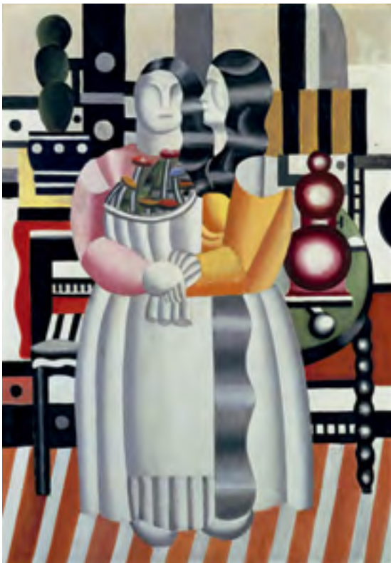
Fernand Léger (1881 – 1955)