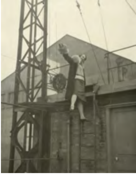
Jacqueline Delubac habillée en Schiaparelli, 1927 Tirage argentique d'époque Paris, Succession Jacqueline Delubac