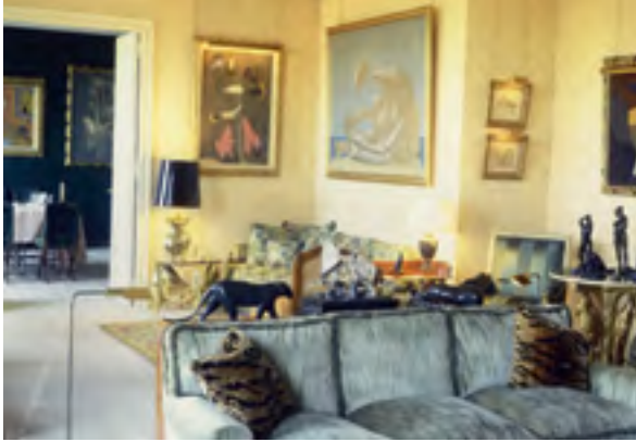
Salon de l'appartement parisien de Jacqueline Delubac Tirage argentique