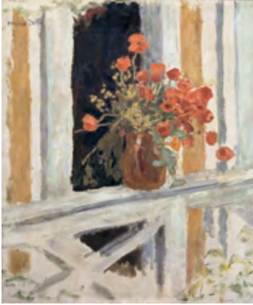
Pierre Bonnard ( 1867 - 1947 )