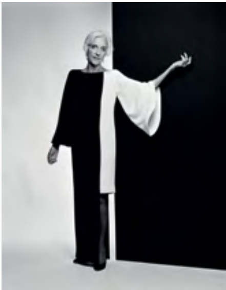
Jacqueline Delubac dans une robe asymétrique de Pierre Cardin Tirage moderne

Jacqueline Delubac avait fait le choix de la modernité. Son élégance, son audace comme son indépendance de goût, l'auront toujours distinguée.