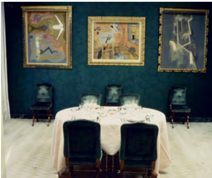
Salle à manger de l'appartement parisien de Jacqueline Delubac Tirage argentique Documentation du Musée des Beaux-Arts de Lyon © Droits réservés