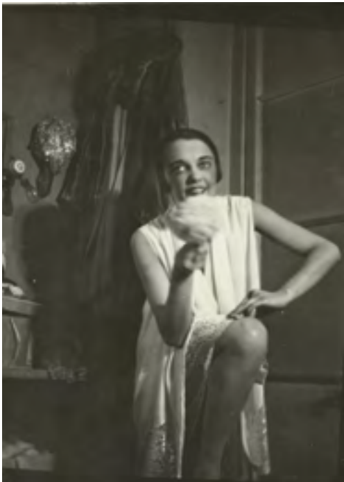
Jacqueline Delubac dans sa loge des Bouffes-Parisiens pour la Revue de Rip « Au temps de Gastounet », Saison 1927-1928

Elle choisit d'adopter le nom de jeune fille de sa mère et monte très vite sur scène. Elle apparaît dans quelques revues, comme celle où elle se produit en imitatrice de Joséphine Baker au Théâtre de l'Empire, et figure même, déjà, dans quelques films : Chérie (1930) et Marions-nous (1931) de Louis Mercanton puis Une brune piquante (1931) de Serge de Poligny. Sa carrière débute réellement en 1931 lorsqu'elle décroche le rôle d'une jeune Anglaise pour une pièce du célèbre auteur et metteur en scène Sacha Guitry. Elle se voit d'abord confier des seconds rôles, l'accompagne l'année suivante en tournée à Londres puis, de retour dans la capitale, accède au rôle principal de sa dernière création, Châteaux en Espagne . Partageant désormais la vie de l'homme de théâtre, Jacqueline Delubac devient dès lors l'une de ses interprètes de prédilection, jusqu'à leur séparation en 1939. Après avoir joué une cinquantaine de rôles sur scène et à l'écran, Jacqueline Delubac interrompt sa carrière au début des années 1950. Elle commence alors une importante collection d'art moderne et devient une figure du Tout-Paris.