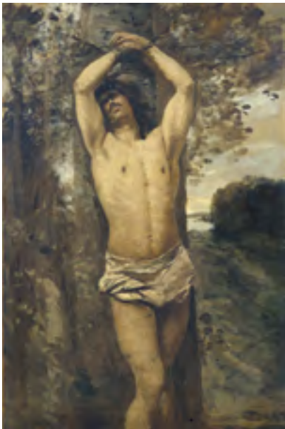
Jean-Baptiste Camille Corot (1796 - 1875) Saint Sébastien, non daté Huile sur toile Lyon, musée des Beaux-Arts