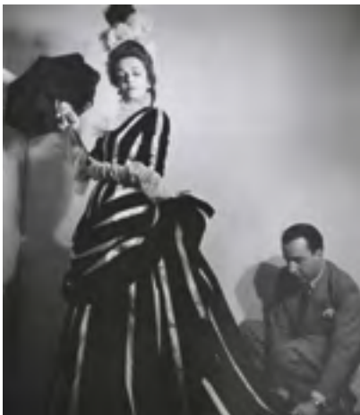
Essayage de Jacqueline Delubac de sa robe pour La Parisienne créée par Antonio Castillo pour Paquin, 1945 Tirage argentique d'époque

Vers 1933, deux ans après sa rencontre avec Sacha Guitry, Jacqueline Delubac emménage dans la demeure de l'auteur située 18 avenue Élisée-Reclus à Paris. Le 21 février 1935, elle devient sa troisième épouse.