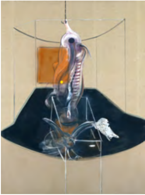
Francis Bacon (1909-1992) Carcasse de viande et oiseau de proie, 1980 Huile sur toile Lyon, musée des Beaux-Arts