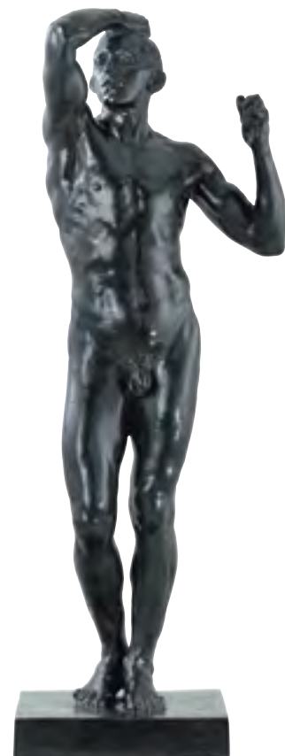
Auguste Rodin (1840 – 1917) L'Âge d'airain , 1876 – 1877 Bronze, après 1895 – 1900 Lyon, musée des Beaux-Arts

Toutefois, la collection de Myran Eknayan ne se limitait pas à la peinture impressionniste puisqu'elle comptait notamment un étonnant Saint Sébastien de Corot et un Picasso de jeunesse, le Nu aux bas rouges peint à Paris en 1901. Admirateur de l'œuvre de Rodin, Myran Eknayan avait également réuni quelques plâtres et une vingtaine de ses bronzes. Trois d'entre eux ont été légués à Lyon ; les autres ont été vendus aux enchères avec certains tableaux, à la suite du décès de Jacqueline Delubac.