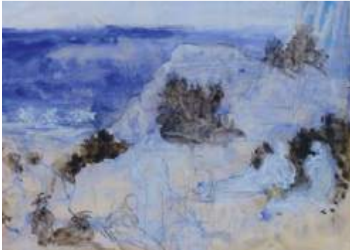
Pierre Puvis de Chavannes (1824-1898) Étude pour Vision antique Vers 1885 Aquarelle sur traits de crayon graphite sur papier ■ Achat auprès d'une galerie avec le concours de l'État et de la Région Rhône-Alpes dans le cadre du FRAM, 2014

Vision antique constitue l'une des quatre compositions réalisées par Pierre Puvis de Chavannes pour le décor de l'escalier du musée des Beaux-Arts, dont la commande lui est confiée en 1883. L'artiste recrée ici une image idéale de la Grèce antique: un jeune berger joue de la flûte, écouté par des femmes qui viennent chercher de l'eau à une fontaine. À l'arrière-plan à gauche, des cavaliers galopent sur la plage. De nombreux dessins préparatoires pour cette grande toile, marouflée sur le mur, sont connus. Parmi cet ensemble, cette étude à l'aquarelle se détache par sa grande liberté. Les lignes générales du tableau sont déjà présentes mais le paysage prend un aspect onirique par l'usage original du médium.