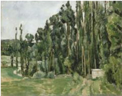
Paul Cézanne (1839-1906) Les Peupliers 1879-1880 Huile sur toile ■ Dépôt du Musée d'Orsay, 2015

Le paysage représenté par Paul Cézanne dans ce tableau se situe certainement près de Pontoise, en Île-de-France, et correspondrait au mur extérieur du parc du château de Marcouville, le long duquel un bouquet de peupliers borde la rivière Viosne. Camille Pissarro avait déjà peint ce même site quelques années auparavant, et c'est sans doute la raison pour laquelle l'artiste s'y intéresse. La facture, présentant un traitement des éléments par hachures, est très caractéristique de l'art de Cézanne au tournant des années 1870-1880. L'artiste joue de nombreuses variations dans les tons de vert afin d'animer la toile et de donner un sentiment de profondeur et d'espace. Il offre également l'image d'une nature ordonnée et maîtrisée par l'homme, accentuée par la verticalité des hauts peupliers.