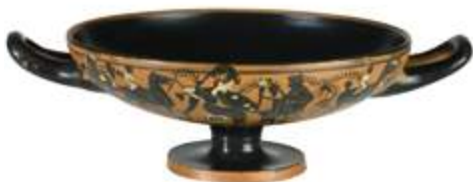
Coupe Attribuée au Leafless Group Athènes, 1 er quart du V e siècle avant J.-C. Céramique à figures noires et rehauts de couleur, blanc et rouge violacé ■ Don de Michel Descours, 2012

La scène mythologique figurée sur la vasque de cette coupe – Dionysos, le dieu du vin, et divers personnages au milieu de ceps de vigne et de grappes de raisin – évoque le précieux breuvage contenu dans le récipient. De chaque côté, Dionysos, tenant une corne à boire, et une femme (notamment la déesse Athéna, reconnaissable à son casque et à son bouclier) sont assis face à face. Autour d'eux sont représentés des cavaliers et un hoplite (fantassin).