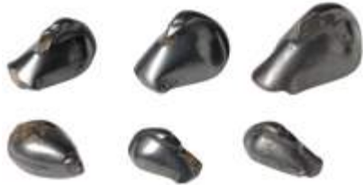
Poids mésopotamiens en forme de canard troussé et de coquillage Hématite, 1 er millénaire av. J.-C. ■ Dons de Michel Descours, 2009

Les collections du médaillier se sont également enrichies de pièces étonnantes et précieuses provenant du cabinet de Michel Descours tels ces petits poids mésopotamiens zoomorphes en hématite. D'autres « curiosités » ont été régulièrement données au cours des dix dernières années et sont exposées à leurs côtés.