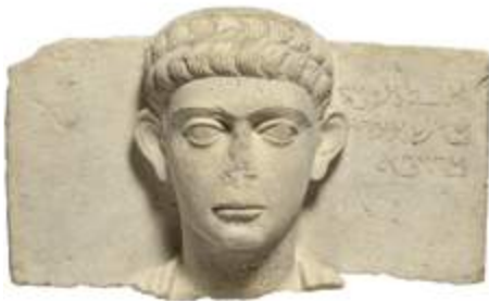
Bas-relief au nom de Malikou Palmyre, II e siècle après J.-C. Calcaire

■ Legs de Magdeleine, Dupont-Sommer, 2011