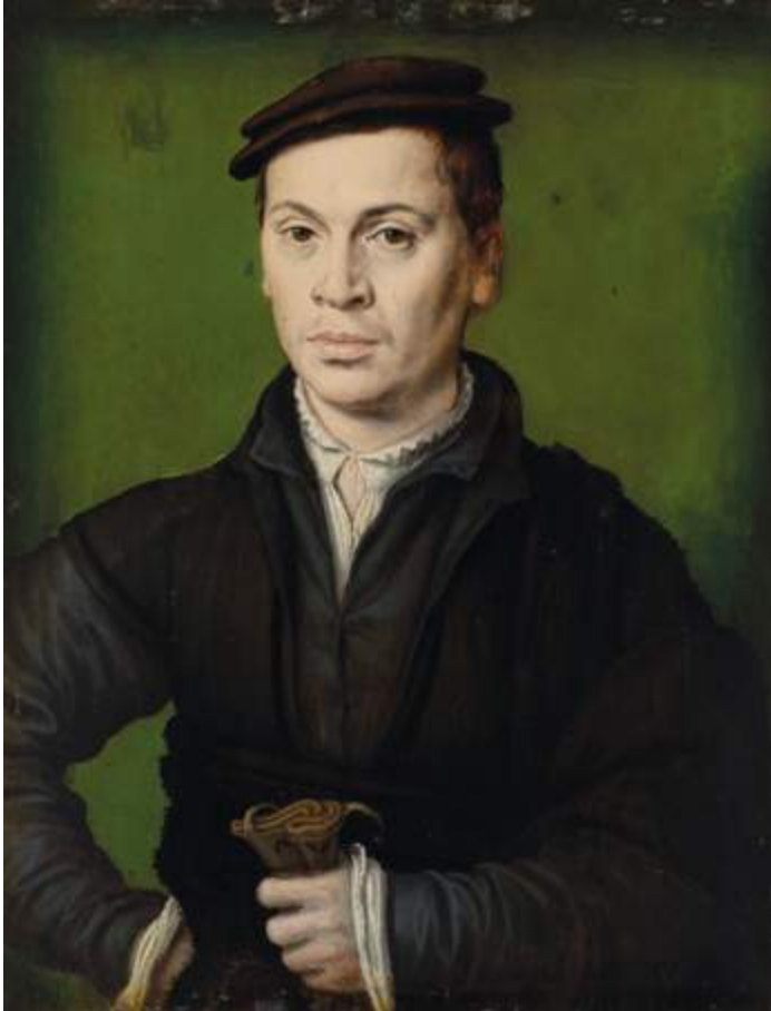
Corneille de Lyon (entre 1500 et 1510-1575), Homme au béret noir tenant une paire de gants Vers 1530 Huile sur bois, 24,1 x 18,5 cm.

Corneille de Lyon est l'un des plus grands peintres de portraits du XVI e siècle. Doté du titre de peintre du roi, il a aussi réalisé de nombreux portraits de bourgeois et de lettrés lyonnais. Ses œuvres, rares, sont collectionnées dans les plus grands musées du monde et il est très exceptionnel d'avoir l'occasion d'en acquérir une. Une souscription publique est en cours afin de faire entrer ce chef d'œuvre dans les collections du musée des Beaux-Arts de Lyon. A l'automne 2015 une exposition consacrée à la Renaissance à Lyon se tiendra au musée des Beaux-Arts. L'Homme au béret noir tenant une paire de gants en sera une pièce maîtresse.