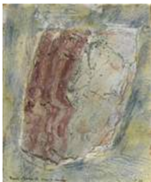
Jean Fautrier (1898-1964) Tête de partisan Huile, colle, poudre de pastels et rehauts d'aquarelle sur papier marouflé sur toile

■ Dation, 2013 Dépôt du musée national d'art moderne / Centre de création industrielle, Centre Pompidou, Paris, 2015