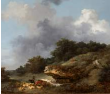
Jean-Honoré Fragonard (1732-1806) L'Abreuvoir Vers 1765 Huile sur toile

■ Achats avec le concours du Club du musée Saint-Pierre, 2013