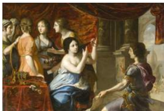
Jacques Stella (1596-1657) Sémiramis appelée au combat 1637 Huile sur ardoise ■ Achat auprès d'une galerie, 2006

Grand décorateur, le Lyonnais Antoine Coysevox a tout autant marqué l'art du portrait sculpté français du XVIII e siècle. Portraitiste principal de Louis XIV, il réalise également, à la fin de sa vie, plusieurs bustes du jeune Louis XV, à peine âgé de cinq ans lorsqu'il monte sur le trône en 1715. L'attitude et l'habit du modèle sont à chaque fois les mêmes. Seuls les traits varient, témoignant de l'œuvre du temps. En 1719, il modèle dans la terre ce nouveau portrait du monarque, première idée du buste officiel en marbre conservé au château de Versailles, dont des répliques en cire témoignent du succès. Tandis que le marbre présente une abondance de détails, le traitement de ce modelage est plus allusif. L'artiste parvient à concilier l'expression de l'enfance et le faste du pouvoir. Cette œuvre fait de Coysevox un précurseur, les portraits autonomes d'enfants se multipliant seulement à compter du milieu du siècle.