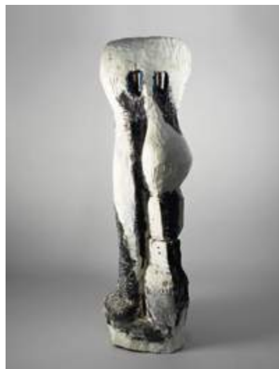
Étienne-Martin (1913-1993) Hommage à Brown 1988-1990 Bois de frêne peint

Après une formation à Londres, le peintre Jean Fautrier revient à Paris, sa ville natale, à la fin de la Première Guerre mondiale. À partir des années 1940, la figuration disparaît dans son oeuvre au profit d'un travail sur la matière. Ce processus de « dé-figuration » correspond à une réaction face à la guerre et à la déshumanisation. C'est la période dite des « hautes pâtes » en raison de forts empâtements picturaux. Sur du papier marouflé sur toile, l'artiste applique un enduit épais qui détermine un champ sur lequel il applique d'autres couches de pâte et des poudres de couleurs. Considéré de son vivant comme le précurseur de la peinture informelle, Fautrier est invité à exposer en Europe, aux États-Unis ou au Japon. Dans la lignée de la série des Otages peinte en 1945, la Tête de partisan est une oeuvre de maturité. Elle appartient à la série des Têtes de partisans de Budapest (1956-1957), hommage aux insurgés Hongrois face à l'invasion des chars soviétiques.