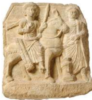
Bas-relief au héros cavalier Syrie du nord, I er – II e siècle après J.-C. Calcaire ■ Achat auprès d'une galerie, 2007

Au fond de la coupe, le médaillon central figure une Sirène, animal fantastique associant un corps d'oiseau et une tête féminine. La technique de la figure noire consistait à peindre les silhouettes avec un « vernis », qui en grésant dans une atmosphère réductrice, conservait sa couleur noire, alors que par oxydation lors de la postcuisson la pâte reprenait une teinte claire. L'incision des détails et les rehauts de couleurs donnent vie à la scène.