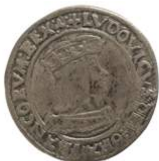
Louis XII, roi de France Teston en argent frappé à Lyon en 1514