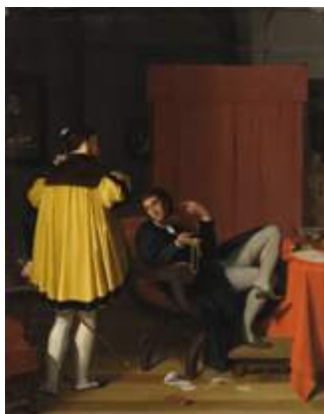
Jean Auguste Dominique Ingres (1780-1867) L'Arétin et l'envoyé de Charles Quint 1848 Huile sur toile

■ Achat avec le concours du Club du musée Saint-Pierre, du Cercle Poussin, de l'État et de la Région Rhône-Alpes dans le cadre du FRAM et d'une souscription publique qui a réuni 1500 donateurs, 2013