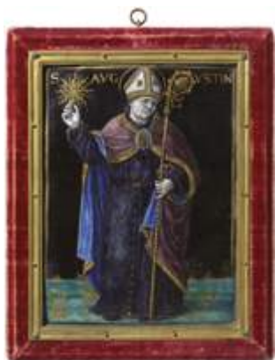
France, Limoges Plaque de retable XVI e siècle Émail peint sur cuivre ■ Dation, 2014 Dépôt du Musée du Louvre, 2015

En 1843, la Ville de Lyon faisait l'acquisition d'un retable incomplet ayant pour thème le triomphe du Christ dans le ciel et, sur la terre, celui de l'Église dans la communion des saints. Nous ignorons toujours sa provenance et sa date de création mais, selon l'hypothèse la plus vraisemblable, la hauteur de l'ensemble originel devait culminer à plus de deux mètres, ce qui en fait l'un des plus grands retables de panneaux d'émail peint connus. En 2003, le musée achetait sur le marché de l'art la plaque représentant Marie-Madeleine tandis que le Musée de l'Évêché, à Limoges, acceptait de déposer à Lyon celle figurant saint Louis.