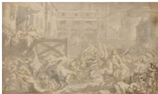
Jacques Stella (1596-1657) L'Enlèvement des Sabines Plume et encre brune sur tracé à la pierre noire, lavis gris, rehauts de gouache blanche, reprises à la plume et encre brune

En raison de la sensibilité du papier à la lumière, ces œuvres ne peuvent être exposées en permanence, de manière à assurer leur conservation. Beaucoup d'entre elles sont ainsi présentées pour la première fois au public à l'occasion de cet accrochage.