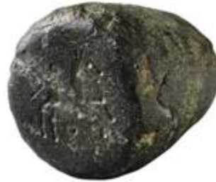
Coin monétaire gaulois Bronze, milieu du 1 er siècle av. J.-C. ■ Don des inventeurs, 2012

Les collections du médaillier se sont également enrichies de pièces étonnantes et précieuses provenant du cabinet de Michel Descours tels ces petits poids mésopotamiens zoomorphes en hématite. D'autres « curiosités » ont été régulièrement données au cours des dix dernières années et sont exposées à leurs côtés.