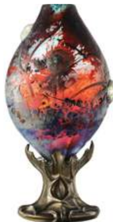
Émile Gallé (1846-1904) Vase Vers 1900 Verre soufflé, bronze doré ■ Achat grâce au cabinet Bonnet, 2009

Ces cinq nouvelles plaques, acceptées par l'État à titre de dation, ont d'abord intégré les collections nationales avant d'être déposées au musée où elles rejoignent le retable auquel elles avaient jadis appartenu.