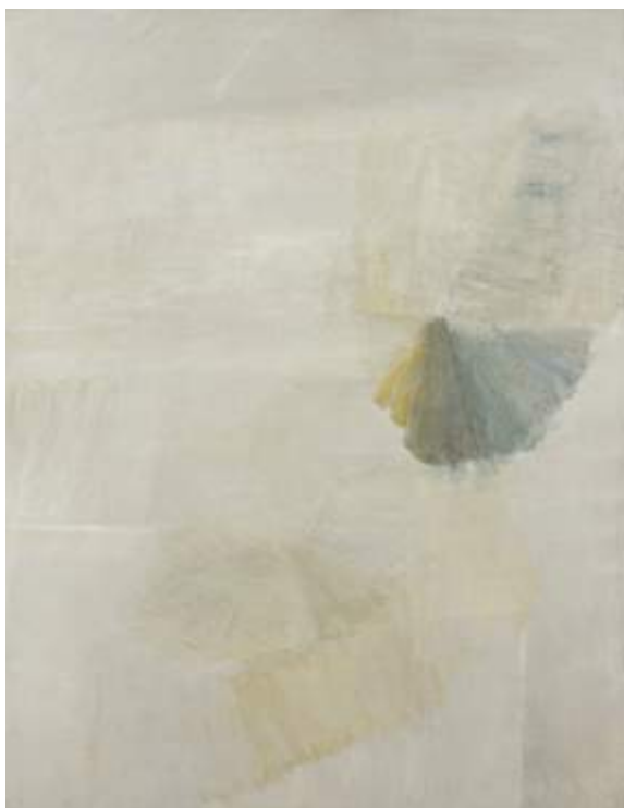
Geneviève Asse (née en 1923) Composition Couleurs dans l'espace [Couleurs de l'espace] 1966 Huile sur toile ■ Don de l'artiste, 2011

Cette exposition entre en résonance avec les œuvres qui figurent dans la collection permanente du musée. Ainsi en va-t-il des Boîtes bleues (1948-1950), regardant vers l'art ancien, ou de la Composition Couleurs dans l'espace [Couleurs de l'espace] (1966) et du Triptyque Peinture de 1970, témoignages du dépassement figuratif de l'après-guerre, représentés dans la collection d'art moderne du musée.