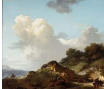
Jean-Honoré Fragonard (1732-1806) Le Rocher Après 1780 Huile sur toile

■ Achats avec le concours du Club du musée Saint-Pierre, 2013