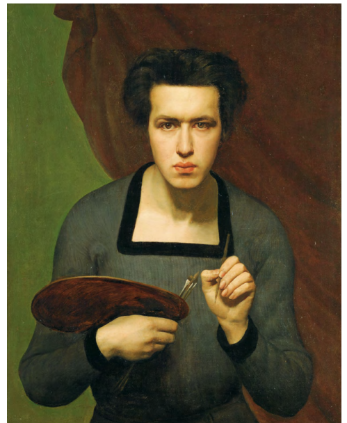
Louis Janmot, Autoportrait , 1832