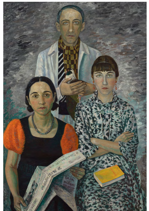
Gino Severini, La Famille du peintre , 1936.