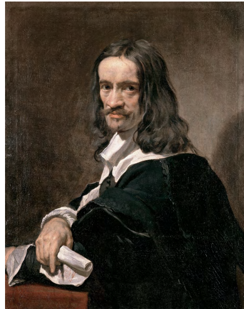
Jacques Stella, Autoportrait , vers 1640.