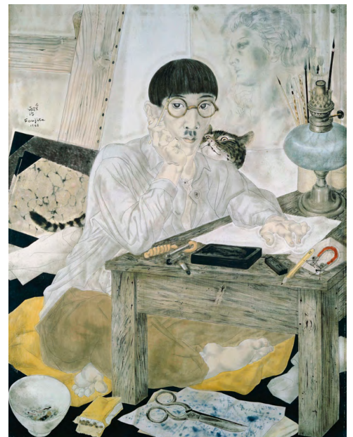
Léonard Tsuguharu Foujita, Autoportrait au chat , 1926.