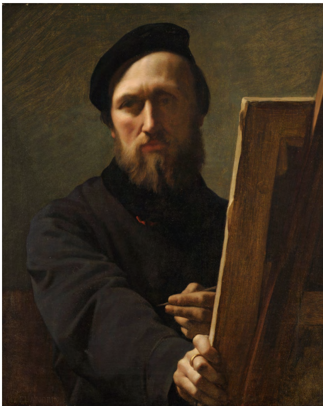
Hippolyte Flandrin, Autoportrait au chevalet , 1860