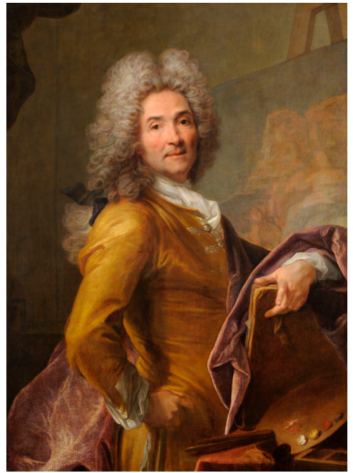
Joseph Vivien, Autoportrait , vers 1715.

Thèmes : Photographie, mise en scène / Image de soi / Selfie Image publique / Réseaux sociaux / Cadrage / Mise en scène / Lumière / Dédoublement